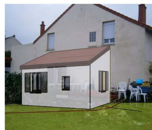
DP6 - Visuel de loin - Après