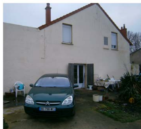
DP7 - Visuel de près - Avant

Objet de la Déclaration Préalable Extension 16 M 2 d'une Maison individuelle