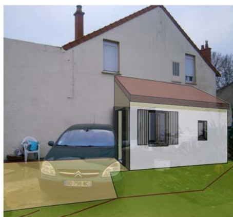
DP5 - Visuel de près - Après