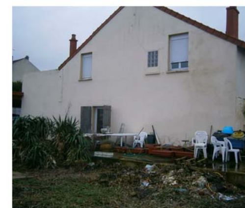
DP8 - Visuel de loin - Avant